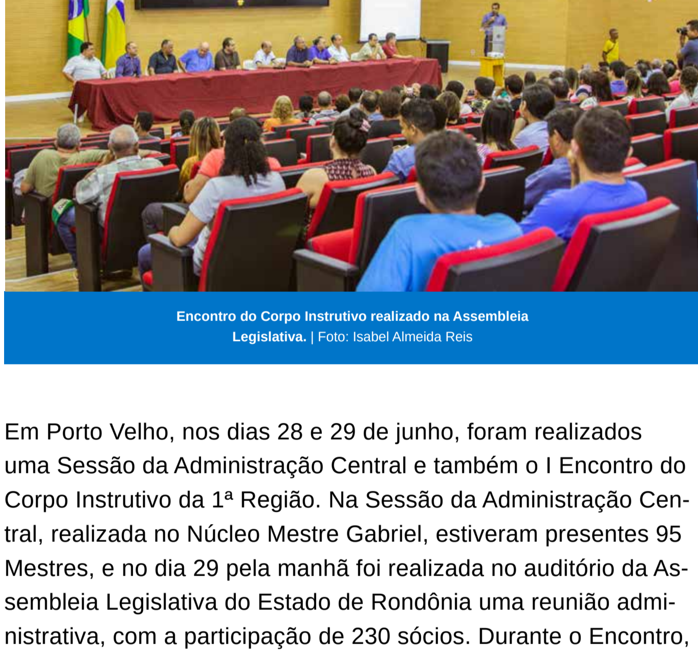
Encontro do Corpo Instrutivo realizado na Assembleia Legislativa.