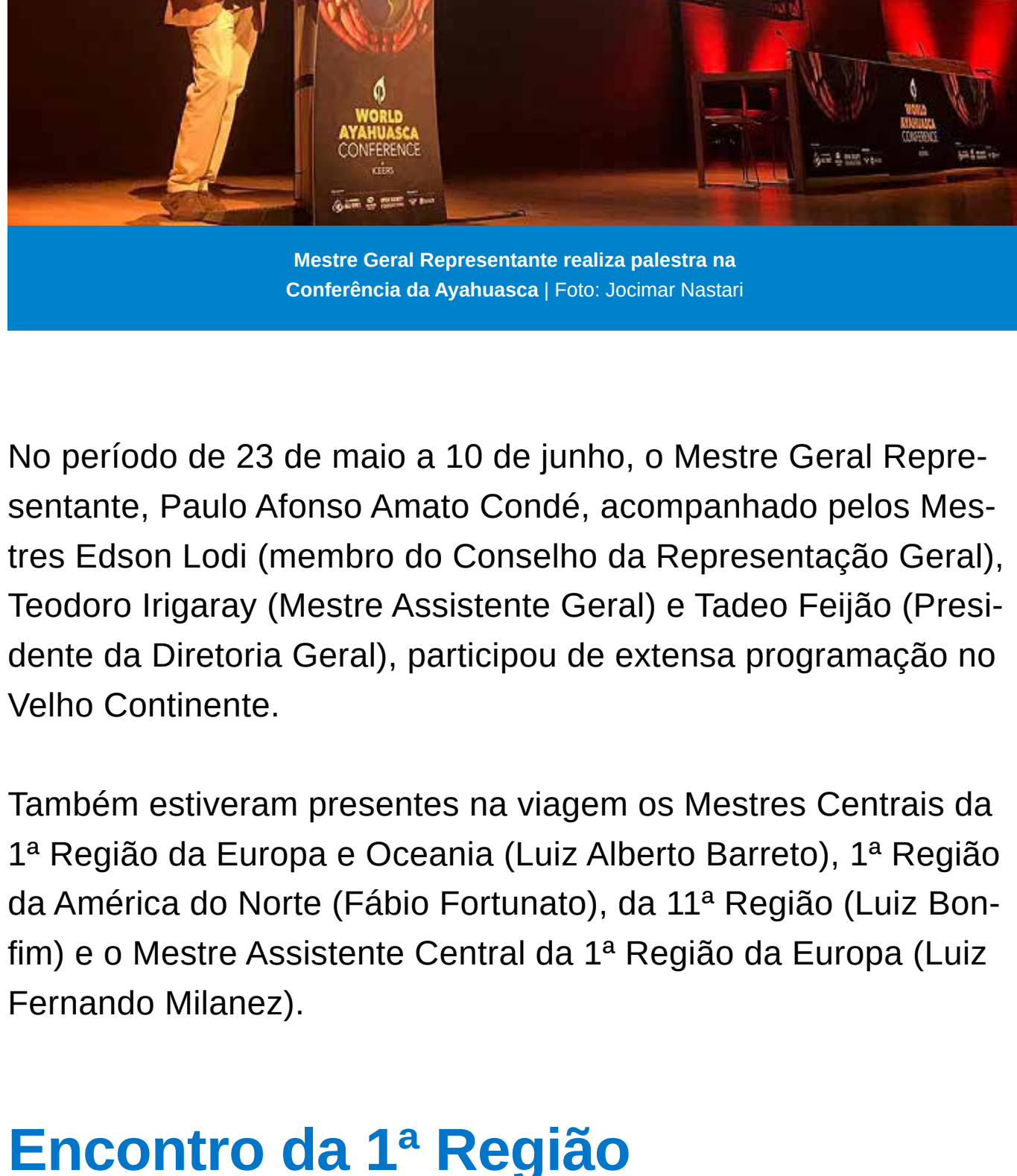
Mestre Geral Representante realiza palestra na Conferência da Ayahuasca