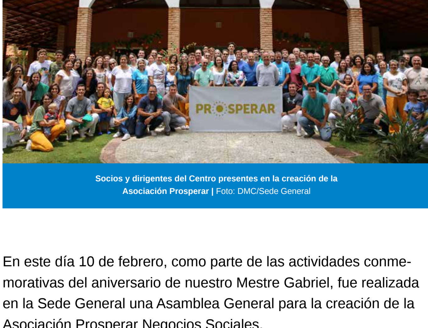
Socios y dirigentes del Centro presentes en la creación de la Asociación Prosperar