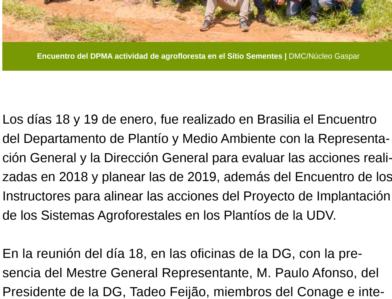
Encuentro del DPMA actividad de agroforesta en el Sitio Semillas | DMC/Núcleo Gaspar

Los días 18 y 19 de enero, fue realizado en Brasilia el Encuentro del Departamento de Plantío y Medio Ambiente con la Representación General y la Dirección General para evaluar las acciones realizadas en 2018 y planear las de 2019, además del Encuentro de los Instructores para alinear las acciones del Proyecto de Implantación de los Sistemas Agroforestales en los Plantíos de la UDV.