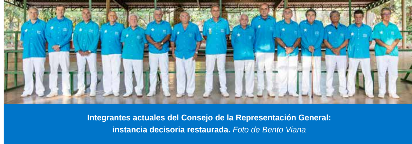
Integrantes actuales del Consejo de la Representación General: instancia decisoria restaurada.

El Conage aprobó, por unanimidad, el restablecimiento del Consejo de la Representación General, constituido por los miembros de la Representación General, Mestres que integran el Consejo de la Recordación de las Enseñanzas del Mestre Gabriel, Mestres que ocuparon el cargo de Mestre General Representante y miembros permanentes del Conage.