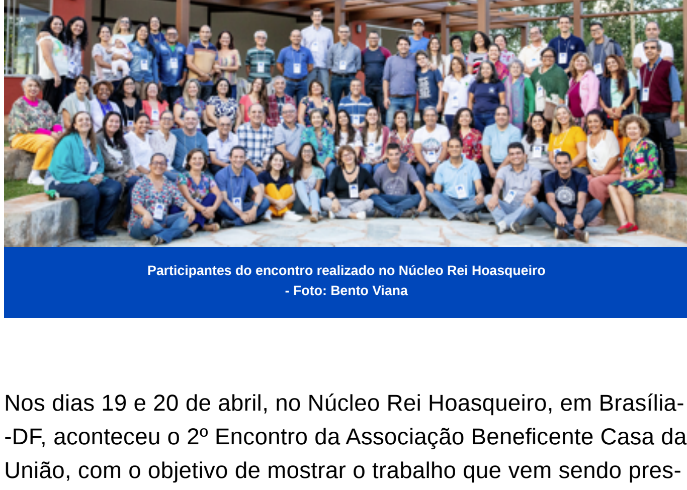
Participantes do encontro realizado no Núcleo Rei Hoasqueiro

Nos dias 19 e 20 de abril, no Núcleo Rei Hoasqueiro, em Brasília-DF, aconteceu o 2º Encontro da Associação Beneficente Casa da União, com o objetivo de mostrar o trabalho que vem sendo prestado nas Casas da União locais de cada Região e Sede Geral e apresentar as novas propostas de capacitação dos beneficiários.