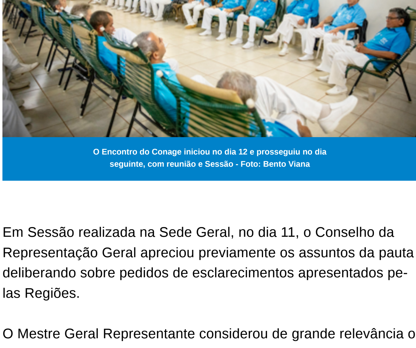
O Encontro do Conage iniciou no dia 12 e prosseguiu no dia seguinte, com reunião e Sessão

De 11 a 13 de abril, o Conselho da Representação Geral (CRG), o Comitê Gestor da Diretoria Geral e o Conselho de Administração Geral (Conage) se reuniram em Brasília para importantes deliberações.