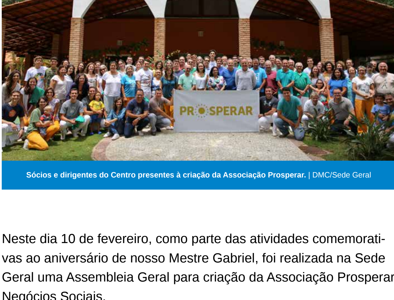
Sócios e dirigentes do Centro presentes à criação da Associação Prosperar.

Neste dia 10 de fevereiro, como parte das atividades comemorativas ao aniversário de nosso Mestre Gabriel, foi realizada na Sede Geral uma Assembleia Geral para criação da Associação Prosperar Negócios Sociais.