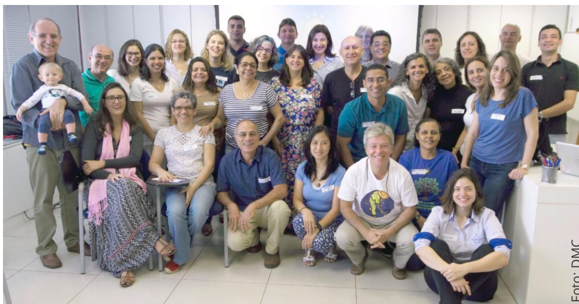
Reunión de la Secretaría General y los Secretarios Regionales de todas las Regiones

Los días 5 y 6 de mayo, se realizó en las instalaciones de la Dirección General un encuentro de la Secretaría General y Secretarías Regionales de todas las Regiones, teniendo como puntos principales de la agenda el Informe Trienal, el Reuni y el Manual de la Secretaría.