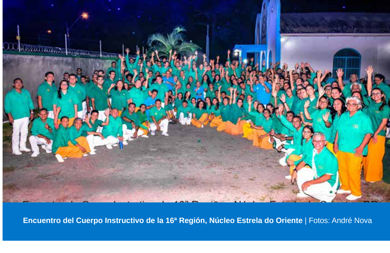
Encuentro del Cuerpo Instructivo de la 16ª Región, Núcleo Estrela do Oriente | Fotos: André Nova