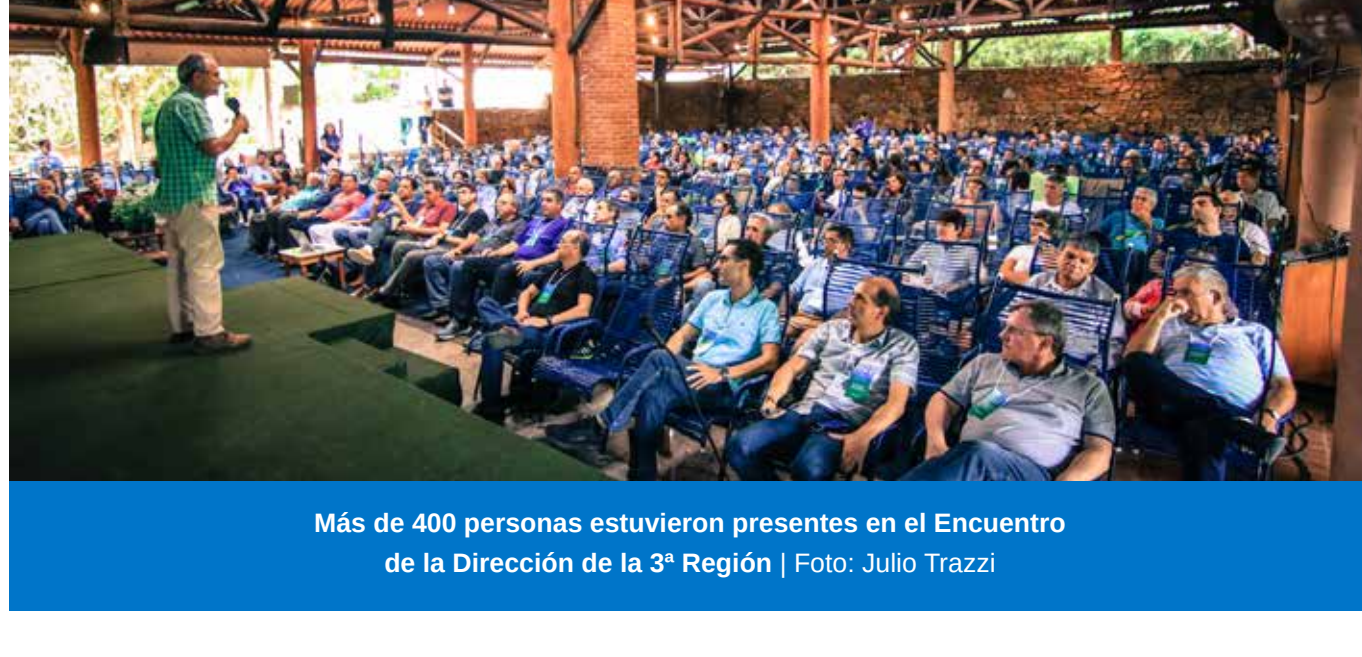
Más de 400 personas estuvieron presentes en el Encuentro de la Dirección de la 3ª Región