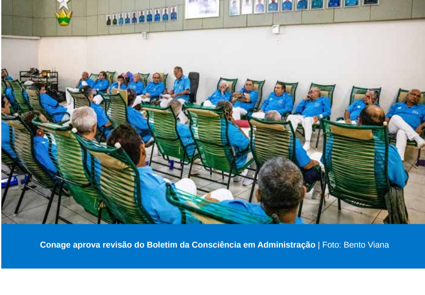
Comitê Gestor apresenta resultado dos Grupos de Trabalho

Seguindo uma programação já tradicional, o Comitê Gestor da Diretoria Geral se reuniu presencialmente no dia 25 de outubro, no escritório da Diretoria Geral, em Brasília.