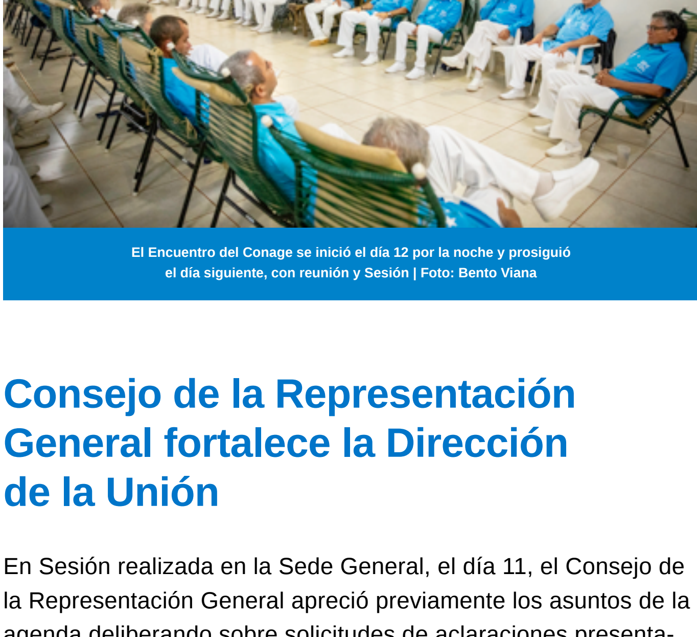
El Encuentro del Conage se inició el día 12 por la noche y prosiguió el día siguiente, con reunión y Sesión

Del 11 al 13 de abril, el Consejo de la Representación General (CRG), el Comité Gestor de la Dirección General y el Consejo de Administración General (Conage) se reunieron en Brasilia para importantes deliberaciones.