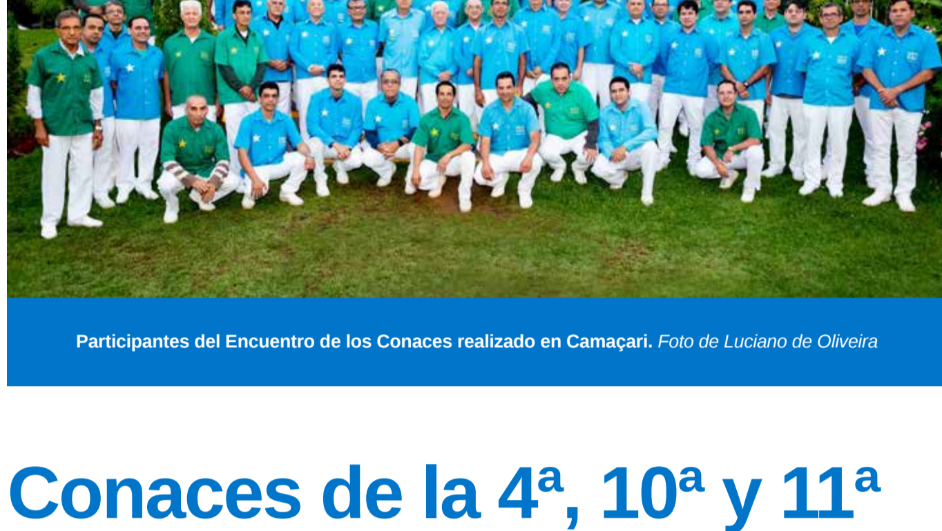
Participantes del Encuentro de los Conaces realizado en Camaçari.

Con los Encuentros en Salvador y Brasilia, la Representación General y la Dirección General completan la agenda de Encuentros con los Conaces en Brasil, quedando para octubre el Encuentro del Conace de la 1ª Región de América del Norte.