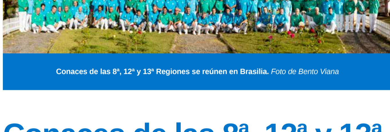
Conaces de las 8ª, 12ª y 13ª Regiones se reúnen en Brasilia.