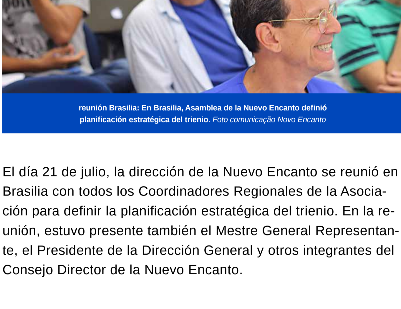
reunión Brasilia: En Brasilia, Asamblea de la Nuevo Encanto definió planificación estratégica del trienio.

El día 21 de julio, la dirección de la Nuevo Encanto se reunió en Brasilia con todos los Coordinadores Regionales de la Asociación para definir la planificación estratégica del trienio. En la reunión, estuvo presente también el Mestre General Representante, el Presidente de la Dirección General y otros integrantes del Consejo Director de la Nuevo Encanto.